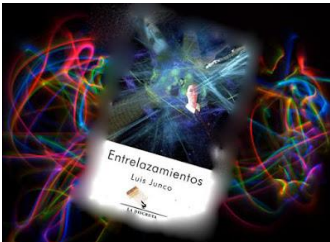
Imagen tomada de "Bardinia". Emilio González Déniz.